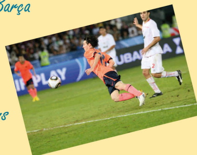
Temporada 2008-09 Semifinals de Champions Chelsea 1-1 Barça