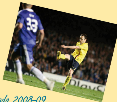
Temporada 2008-09 Semifinals de Champions Chelsea 1-1 Barça