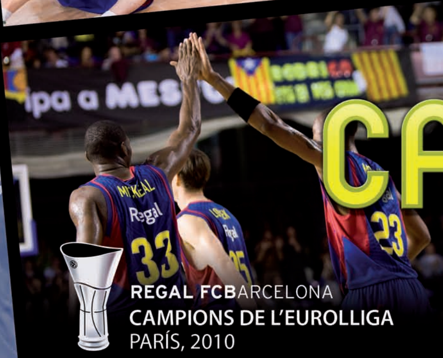
REGAL FC BARCELONA CAMPIONS DE L'EUROLLIGA PARÍS, 2010