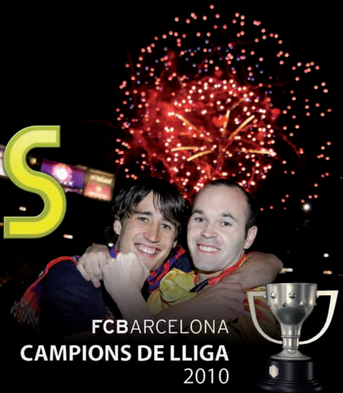
FC BARCELONA CAMPIONS DE LLIGA 2010